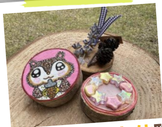
ウッドクラフト体験