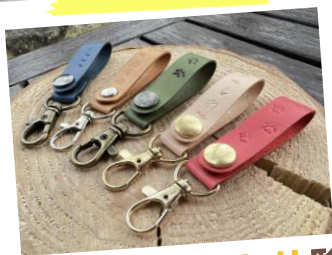
レザークラフト体験