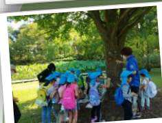
行って見よう！ 弘前公園