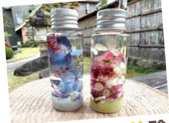
ハーバリウム体験